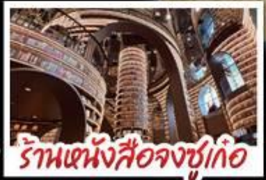
ร้านหนังสือจุงกั๋ว