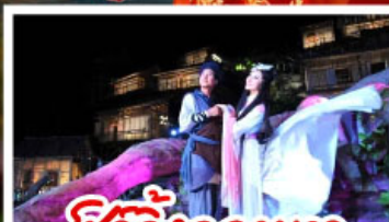
ชีวิตจิ้งจอกขาว