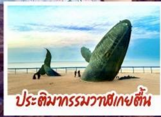
ประติมากรรมวาฬยกขึ้น