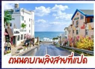
ถนนคอปเปลิงสายที่แปด