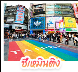
ซีเหมินตง