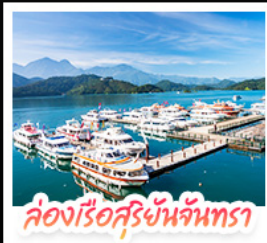
ล่องเรือสุริยจันทร์

ล่องเรือชมทะเลสาบสุริยจันทร์ (SUN MOON LAKE) ชมเกาะลาลู แวง-วัดสวนทอง • อิสระเดินเล่น หมู่บ้านอิต้าซ่า • นั่งรถไฟเล็กโบราณ (1 สถานี) สัมผัสบรรยากาศเส้นทางรถไฟสายธรรมชาติ • ตะลุย ไทจงไม้ไผ่ยักษ์ แหล่งรวมแฟชั่นและสตรีทฟู้ด • ช้อปปิ้งย่าน ซิเหมินตง (XIMENDING) ถ่ายรูปแลนด์มาร์ค ตึกไทเป 101 • ช้อปปิ้งกังหนว่ที่ MITSUI OUTLET PARK ชมความสวยงามของ อนุสรณ์สถานเจียงไคเช็ค • พอร์ควรรักที่ วัดหลงซาน ชมโศกหินเสียดรณีที่ เย่หลิว • ชมบรรยากาศเมืองเก่าที่ จิวเฟิ่น