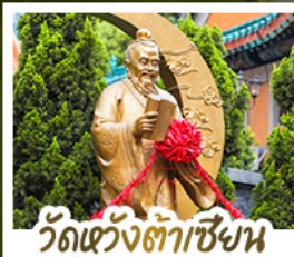
วัดเว่งต่าเซียง