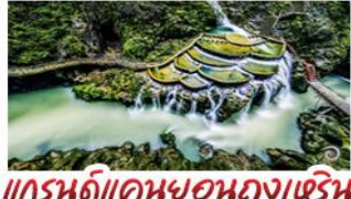
แกรนด์แคนยอนกวงเหริน

เขาฟ่านจิ่ง - เมืองโบราณฝูหรงจั้น เมืองโบราณเฟิ่งหวง - เกาะส้มจิวจี้โจว แกรนด์แคนยอนกวงเหริน - ไม้เข้าน้ำร้อนซ้อป พักโรงแรม 5 ดาว - รถไฟความเร็วสูง