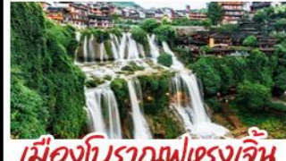
เมืองโบราณฝูเฉว่งเจิน