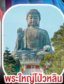
พระใหญ่โป้วหลิน