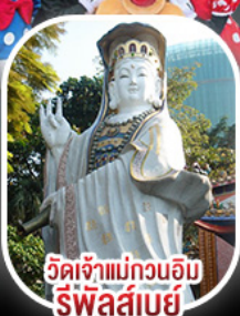
วัดเจ้าแม่กวนอิม รีพัลส์เบย์