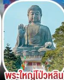
พระใหญ่โป่วหลิน