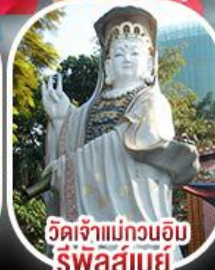
วัดเจ้าแม่กวนอิม รีพัลส์เบย์