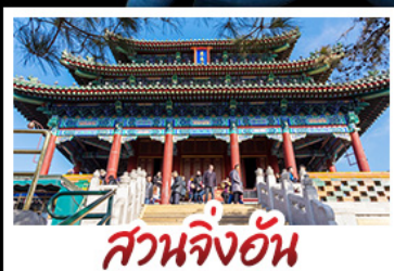
สวนจิงอัน