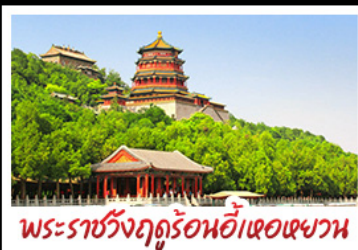
พระราชวังฤดูร้อนอู่เหอหยวน

กำแพงเมืองจีนด่านจวิ้งกวน - พระราชวังฤดูร้อนอู่เหอหยวน สวนจิงอัน - วัดลามะ - ไม่หลงร้านช้อปปิ้ง - โรงแรม 4 ดาว มือพิเศษ เปิดปีกกิ้ง สุกิมองโกล MICHELIN GUIDE ร้าน TAO TAO JU