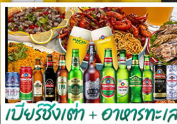
เบียร์ซิงเก๊า + อาหารทะเล