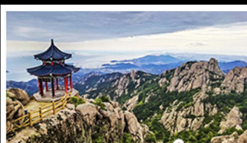
ภูเขาเหลาซาน