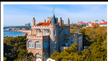
ป่าต๋าทวน

พระราชวังฤดูร้อน - วิวเมืองซิงเต่า รถไฟความเร็วสูง - ภูเขาเหลาซาน กำแพงเมืองจีนด่านจวิยงกวน - ป่าต๋าทวน พักโรงแรมระดับ 4 ดาว - ไม่หลงร้านช้อปปิ้ง มือพิเศษ เปิดปักกิ่ง , หม้อไฟซีฟู้ด