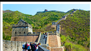
กำแพงเมืองจีนด่านจวิยงกวน