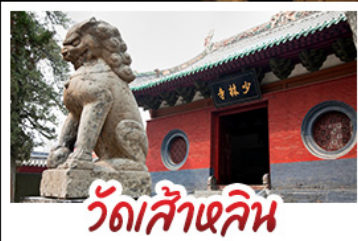
วัดส้าหลิน