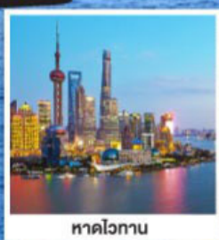
หาดไว่กาน