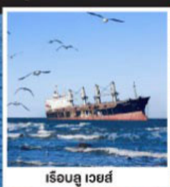
เรือลู เวยส์