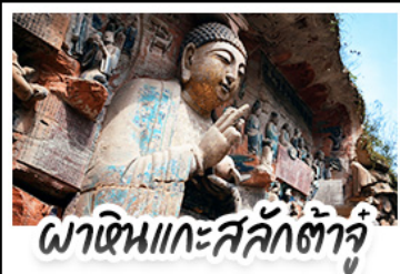
พาเดินแกะสลักต้าจู๋