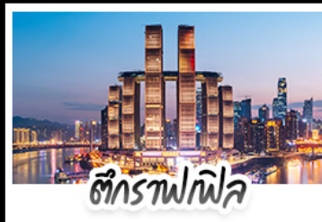
ตึกรางฟิฟล์