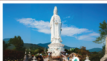
วัดเลิ๊ง