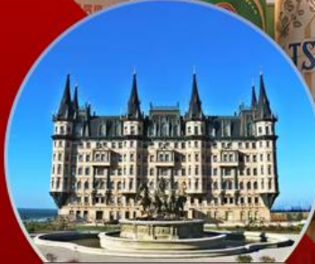
คฤหาสน์เวินเจิง