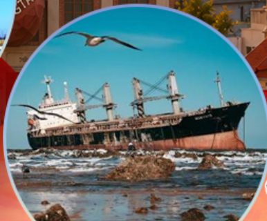
เรืออัปปาง Blueways