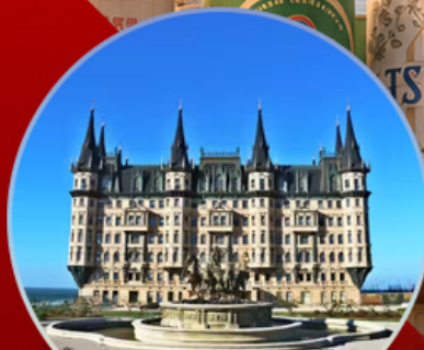
คฤหาสน์เวินเจิง