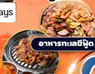
อาหารทะเลซีฟู้ด