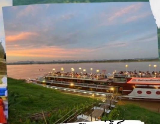
ล่องเรือแม่น้ำโขง