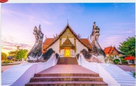
วัดภูมินทร์