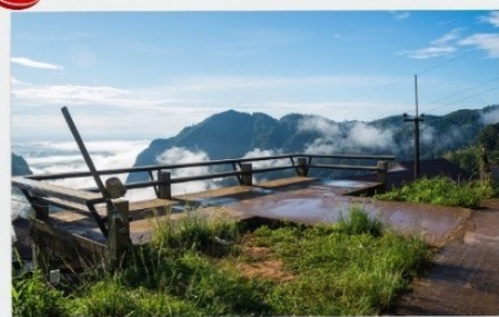
ดอยผาฮี้