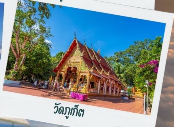
วัดกุ๊กเก็ต