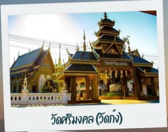
วัดศรีมงคล (วัดก้ง)