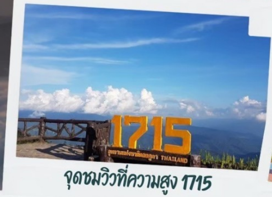
จุดชมวิวที่ความสูง 1715