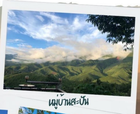
หมู่บ้านสะปัน