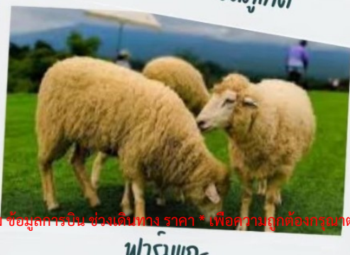
ฟาร์มแกะ