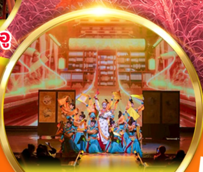
โชว์ราชวงศ์ถัง