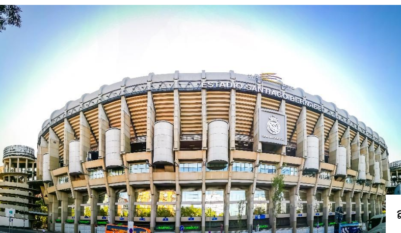
สนามฟุตบอล ซานเตียโก เบร์นาเบว (Estadio Santiago Bernabéu)

ชมด้านหน้า สนามฟุตบอล ซานเตียโก เบร์นาเบว (Estadio Santiago Bernabéu) คือสนามเหย้าของทีม รีล มาดริด (Real Madrid) หนึ่งในสโมสรฟุตบอลที่ยิ่งใหญ่และประสบความสำเร็จที่สุดในโลก ตั้งอยู่ในใจกลางกรุง มาดริด ประเทศสเปน