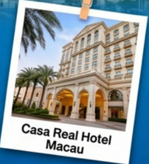
Casa Real Hotel Macau

แพ็คเกจสุดคุ้ม พักหรู 4 ดาวพร้อมอาหารเช้าที่ Casa Real Hotel Macau