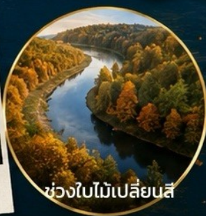
ช่วงใบไม้เปลี่ยนสี