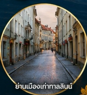
ย่านเมืองเก่าทาลลินน์