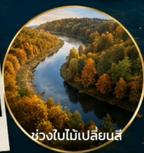
ช่วงใบไม้เปลี่ยนสี