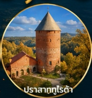
ปราสาทกูโรด้า