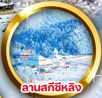
ลานสกีซีหลิง