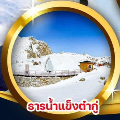
ธารน้ำแข็งต่ำกู่