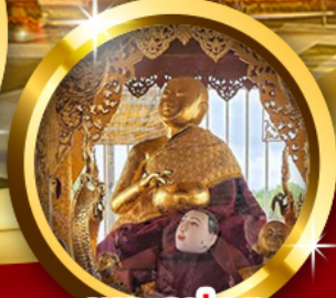
พระอุปคุต