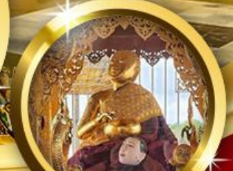
พระอุปคุต