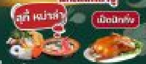
บุ๊ค อาหารเช้า