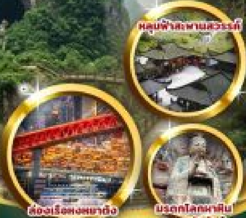
มนต์ฟ้าแดนสวรรค์

เปิดตำนาน "มนต์ฟ้าแดนสวรรค์" เมืองมรดกโลกแห่งมหานทีฉาง เมืองมรดกโลก "ฉ่าจู้แดนสวรรค์" และเมืองมรดกโลกแห่งมหานทีฉาง เมืองมรดกโลกแห่งมหานทีฉาง เมืองมรดกโลกแห่งมหานทีฉาง