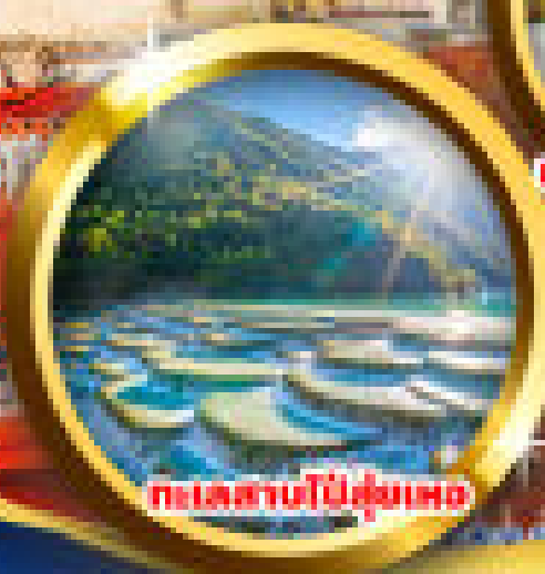
ทะเลสาบป๋าย่ฝูเหมง