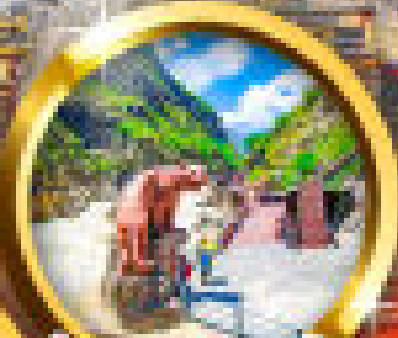
ขี่ม้าชมทิวทัศน์เกรงโจว

นี่คือการท่องเที่ยวในยุคร่วมสมัยที่ทันสมัย ประสบการณ์ที่ใหม่กว่า การเดินทางที่สะดวกสบาย และเพลิดเพลิน เป็นช่วงเวลาที่น่าประทับใจที่สุด ด้วยบริการรถโดยสารความเร็วสูงที่ทันสมัยและปลอดภัย ที่รับรองว่าคุณจะเพลิดเพลินไปกับทุกการเดินทาง และสัมผัสกับเสน่ห์ของวัฒนธรรมจีนที่แท้จริง