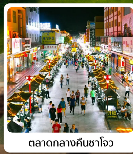
ตลาดกลางคืนซาโจว

ไฮไลท์! ภูเขาสายรุ้งจากเขตนีลเซียภูเขาหลากสีสุดมหัศจรรย์ของจีน ถ้าปีศาจ บรดกโลกแห่งเส้นทางสายไหมอายุเก่าแก่กว่า 1,000 ปี