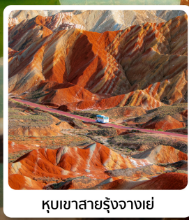
ภูเขาสายรุ้งจากเขตนีลเซีย