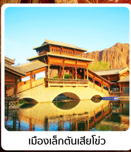
เมืองเล็กต้นเซียโซว