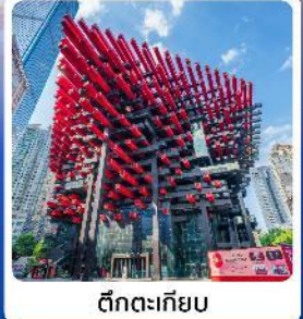
ตึกทะเลเกียบ