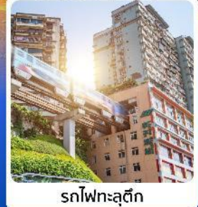
รถไฟฟ้าชุนชิ่ง

ไฮไลท์! เขียนรักกลางใจ พับเก็บไว้ที่จงซิ่ง ชมรถไฟฟ้าทะเลสาบ อลังการแสงสีที่หงหยาดต้ง