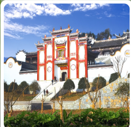
บ้านเกิดชิวหยวน