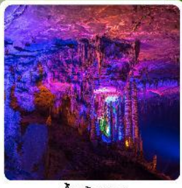
ถ้ำเก้าทง