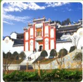
บ้านเกิดชิวหยวน