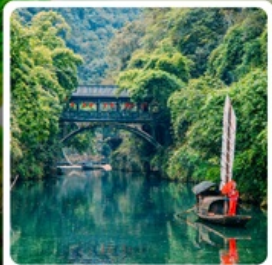
หมู่บ้านชาวน้ำเสียวเรินเจีย