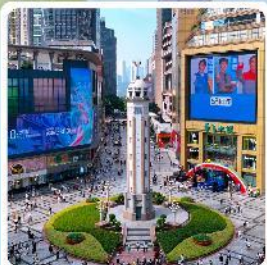
ถนนเจี๋ยฟางเป่ย์