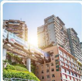
รถไฟฟ้าชุลติ๊ก

ไฮไลท์! เที่ยวอุทยานแห่งชาติหลุมบ่อฟ้า มรดกโลกระดับ 5A ชมรถไฟฟ้ายุคใหม่ อลังการแสงสีที่หงหยาดัง