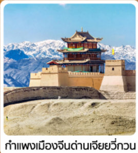
กำแพงเมืองจีนด่านเจียหยวี่กวน