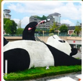
รูปปั้นหมีแพนด้าอนุเชลฟ์