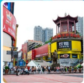
ถนนหวงซิงลู่