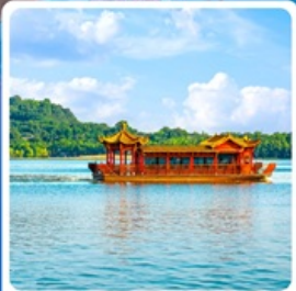
ล่องเรือทะเลสาบหลิวเยว่หู