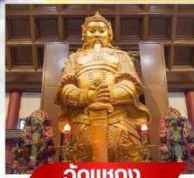
วัดเขกทง