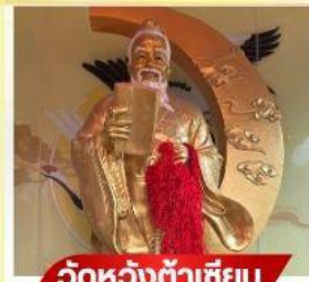
วัดหวังต้าเซียม