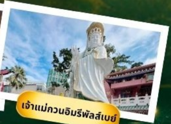
เจ้าแม่กวนอิมริพัลส์เบย์