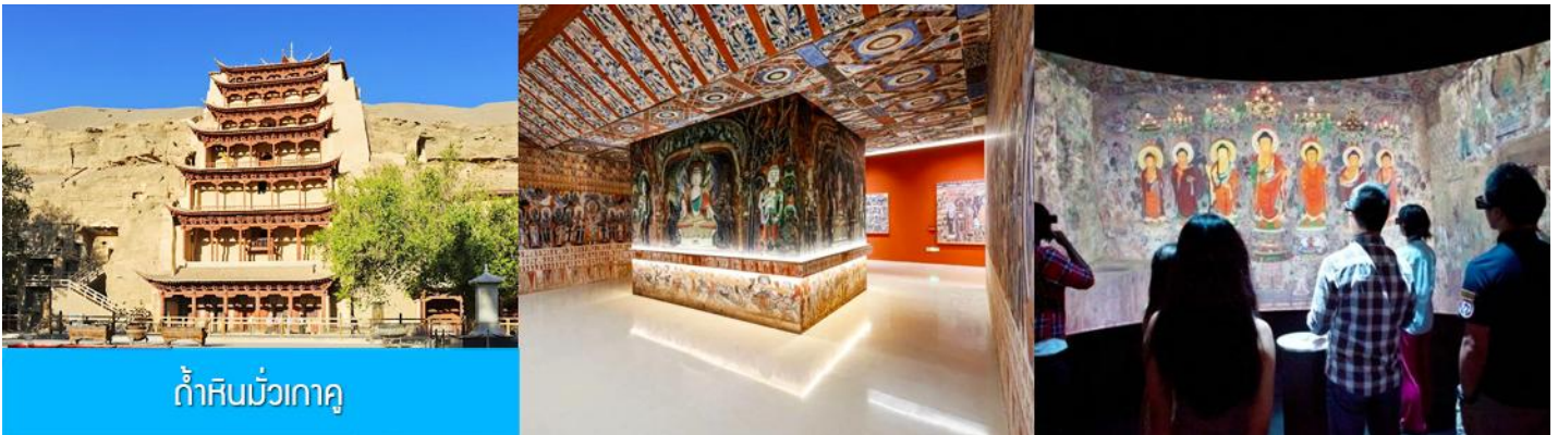
ถ้ำหินมั่วเกาถู

เช้า รับประทานอาหารเช้า ณ ห้องอาหารของโรงแรม (9)