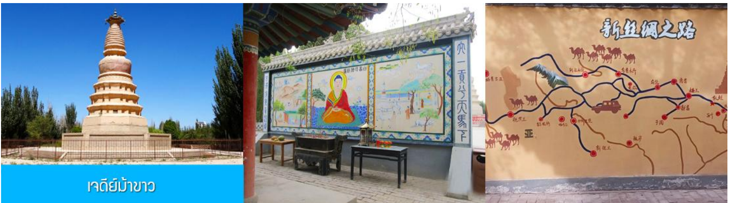
เจดีย์ม้าขาว

เที่ยง รับประทานอาหารกลางวัน ณ ภัตตาคาร (10)