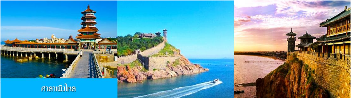
ศาลาเพิ่มไหหล

จนได้เวลาอันสมควรนำท่านเดินทางสู่ คฤหาสน์เหวินเจิง 文成城堡 คฤหาสน์สไตล์ยุโรป ที่ตั้งตระหง่านอยู่ริมทะเลในเมืองเฉียนไถ ที่นี่ไม่ใช่แค่สถาปัตยกรรม แต่คือ ประตูลูกโลกแห่งจินตนาการที่ท่านจะได้สัมผัสความหรูหรา และได้สัมผัสกับสถาปัตยกรรมสไตล์บารอกที่ยิ่งใหญ่ เหมือน หลุดเข้าไปในเทพนิยายของยุโรป ให้ท่านเก็บภาพบรรยากาศตามอัธยาศัย จนได้เวลาอันสมควร นำท่านเดินทางสู่ภัตตาคาร