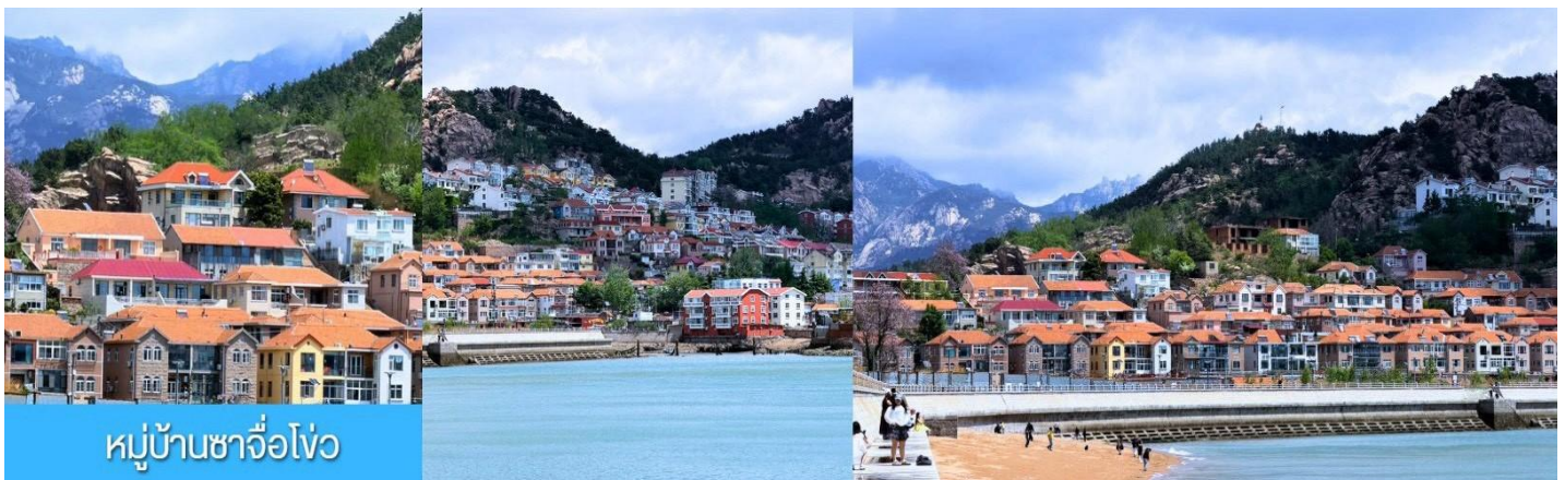
หมู่บ้านซาจื่อโจว

หลังอาหารนำท่านสัมผัสมนต์เสน่ห์ของหมู่บ้านชาวประมง ซาจื่อโจว 沙子口渔村 ให้ท่านได้ชมวิถีชีวิตดั้งเดิมกับทิวทัศน์ชายทะเล วิถีบ้านเรือนหลากสีที่ตั้งเรียงรายตามแนวชายฝั่งที่โดดเด่นด้วยเอกลักษณ์ ทำให้ หมู่บ้านซาจื่อโจว เป็นเอกลักษณ์เป็นจุดถ่ายภาพราวกับเมืองชายฝั่งของอิตาลีในยุโรป, จึงเป็นที่ดึงดูดให้นักท่องเที่ยวต่างอยากมาสัมผัสบรรยากาศ ณ หมู่บ้านชาวประมงซาจื่อโจวแห่งนี้