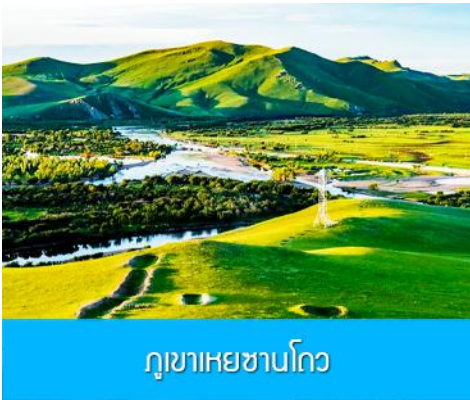
ภูเขาเหยาซานโถว

เช้า รับประทานอาหารเช้า ณ ห้องอาหารของโรงแรม (13)