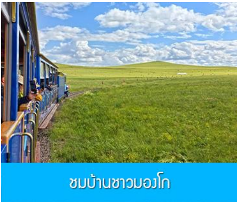
ชมบ้านชาวมองโก

เที่ยง รับประทานอาหารกลางวัน ณ ภัตตาคาร (14)