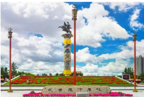
จัตุรัสเวงกิสข่าน

หลังอาหารนำท่านเดินทางสู่เมือง ไห่ลาเอ๋อ 海拉尔市 (ระยะทาง 456 กม. ใช้เวลาเดินทางราว 5 ชั่วโมงครึ่ง)