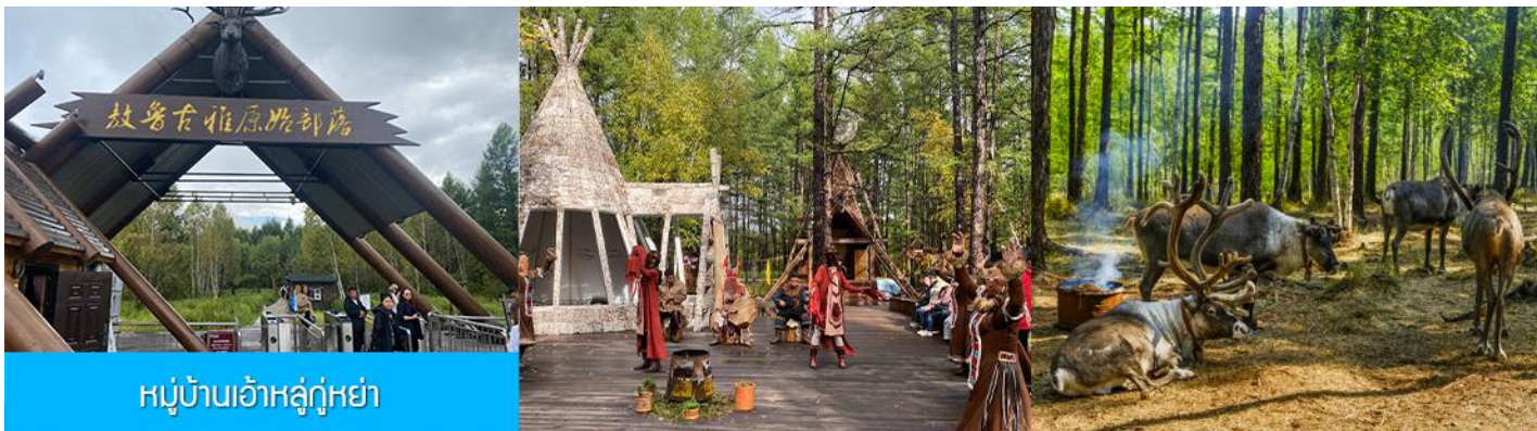
หมู่บ้านเอ้อเอ่อกู่ฮา