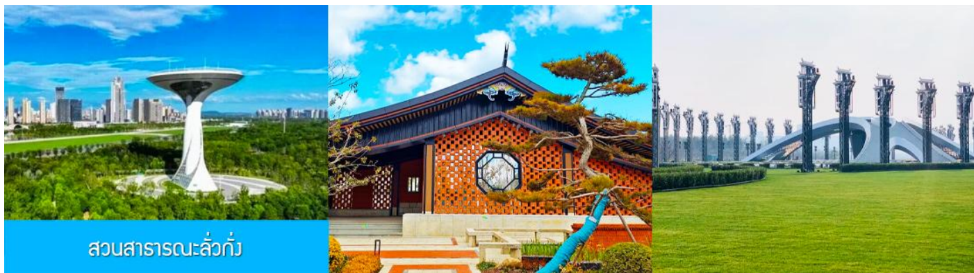
สวนสาธารณะลั่วกั๋ว

เช้า รับประทานอาหารเช้า ณ ห้องอาหารของโรงแรม (8)