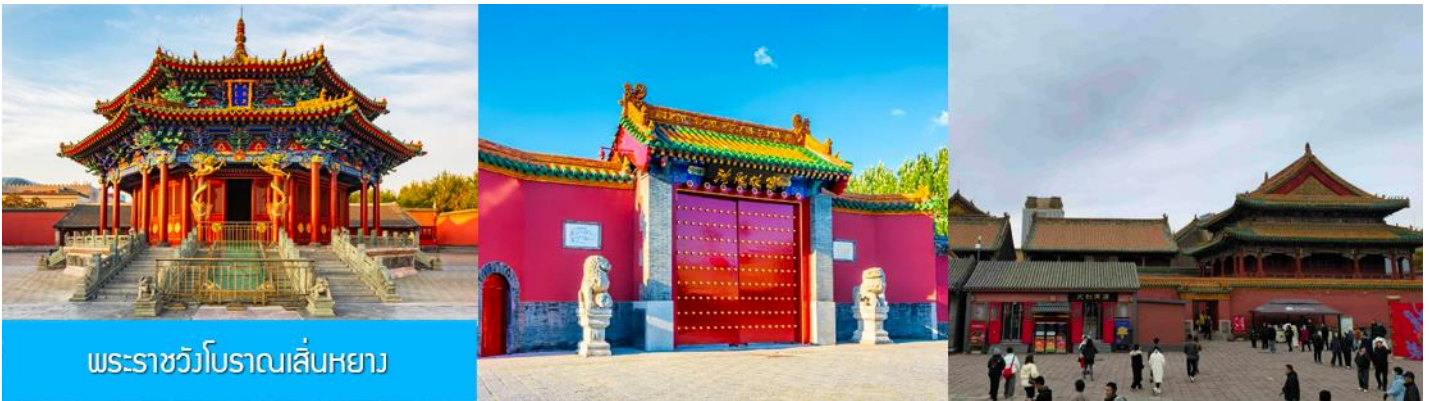
พระราชวังโบราณเสิ่นหยาง

จากนั้นนำท่านเดินทางสู่ เมืองเสิ่นหยาง 沈阳 (ระยะทาง 280 กม. ใช้เวลาเดินทางราว 3 ชั่วโมงเศษ) เที่ยง รับประทานอาหารกลางวัน ณ ภัตตาคาร (8)