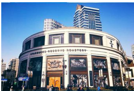
Starbuck Reserve Roastery