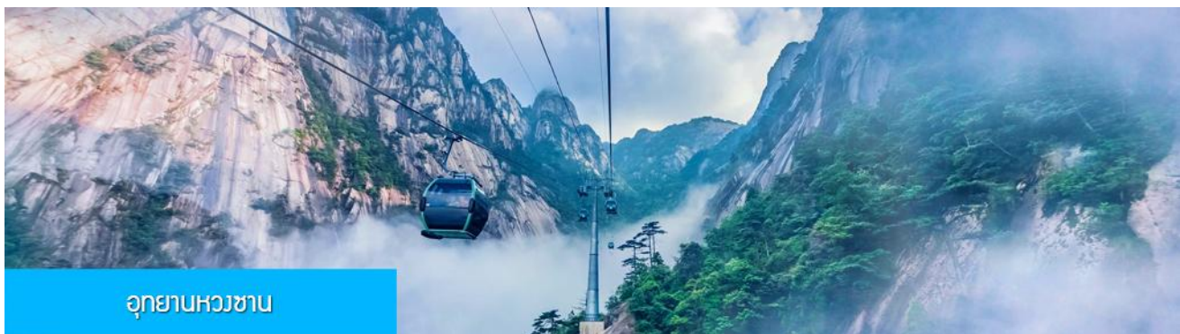
อุทยานหวางซาน