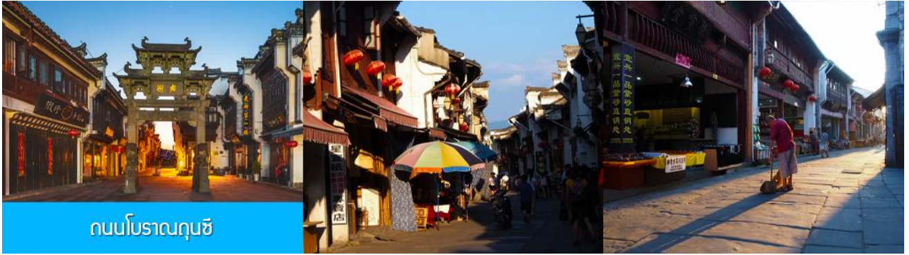
ถนนโบราณถุนซี

นำท่านเที่ยวชม ถนนโบราณถุนซี 屯溪老街 ถนนที่เป็นย่านการค้าโบราณในยุคราชวงศ์ซ่งได้แก่กว่า 700 ปี ถนนมีความยาวราว 1272 เมตร สองฝั่งถนนมีอาคารบ้านเรือนโบราณสไตล์หุยโจวที่สร้างในยุคปลายราชวงศ์หมิงและราชวงศ์ชิงที่ถูกอนุรักษ์ไว้เป็นอย่างดี ปัจจุบันยังมีห้างร้าน โบราณ อาทิ ร้านขายโบราณวัตถุ ร้านขายหยก ร้านขายภาพเขียนและอักษรพู่กันโบราณ ร้านอาหารพื้นเมือง ร้านขายของที่ระลึก ฯลฯ นอกจากนี้ร้านค้าและอาคารบ้านเรือนโบราณที่นี้ยังเป็นแหล่งรวมของนักท่องเที่ยวที่มาชิมอาหารพื้นเมือง เดินช้อปปิ้งและถ่ายภาพ เซ็คอิน