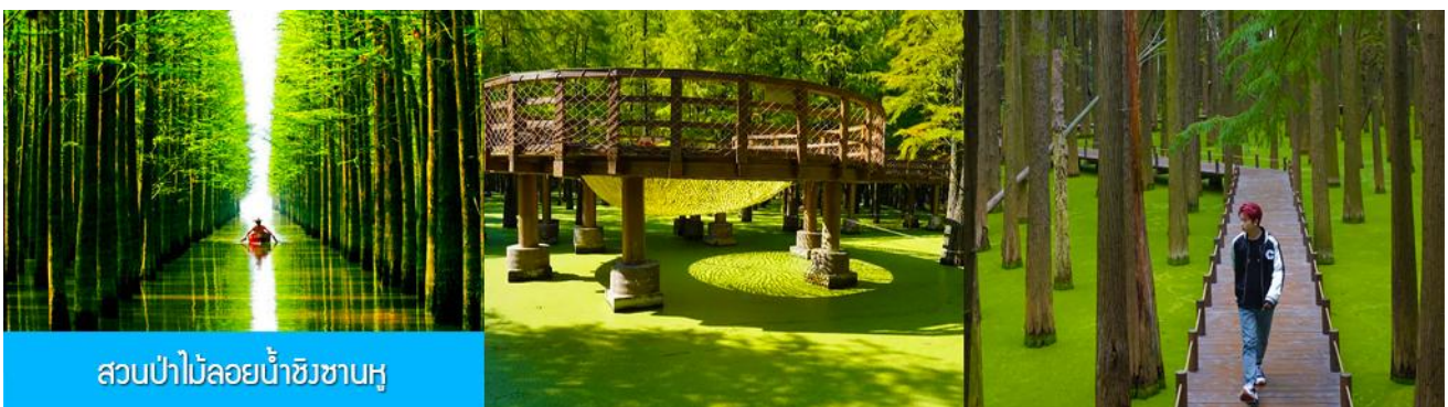
สวนป่าไม้ลอยน้ำชิงซานหู

หลังอาหารเช้าท่านเดินทางโดยรถบัสสู่เมืองหลิงอัน 临安市 (ระยะทาง 175 กม. ใช้เวลาเดินทางราว 2 ชั่วโมงเศษ)