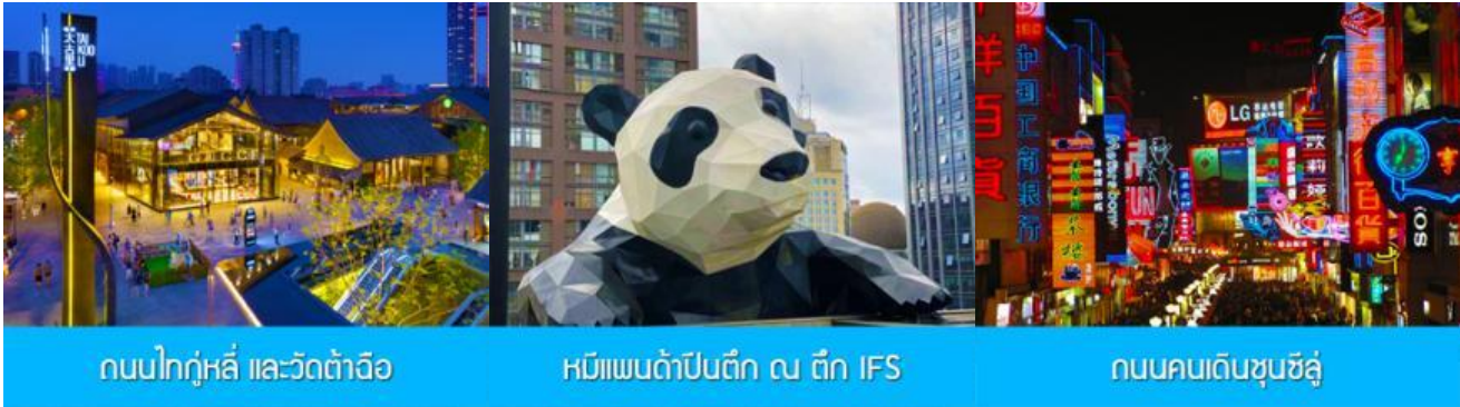
ถนนไท่กู๋หลี่ และวัดต้าฉือ