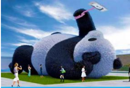
ตุ๊กตาแพนด้าอนเซลฟี