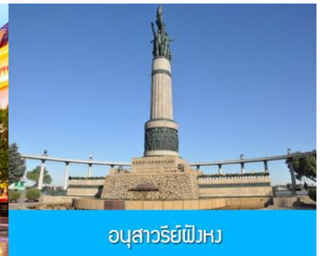
อนุสาวรีย์ฝังหง