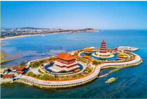
อุทยานท่องเที่ยวแปดเซียนข้ามทะเล