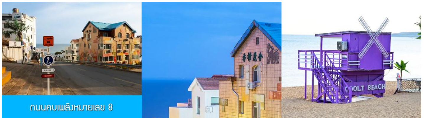
ถนนคบเพลิงหมายเลข 8

เช้า รับประทานอาหารเช้าในโรงแรม (มื้อที่ 3) นำท่านจิบไวน์ในปราสาทสไตล์ยุโรป หลีกหนีความวุ่นวายและก้าวเข้าสู่ดินแดนที่ราวกับหลุดมาจากเทพนิยายยุโรป ณ ไร่ไวน์ ชาโตว์ ณ คตฺหาสน์ จางยู๋ ปราสาทไวน์อันโอ่อ่าที่ตั้งตระหง่านกลางไร่องุ่นสุดลูกหูลูกตาในเมืองเยียนไถ มณฑลซานตง ที่นี่คือการบรรจบกันอย่างลงตัวของมรดกการผลิตไวน์กว่าร้อยปีของจีนและความเชี่ยวชาญจากฝรั่งเศส ทำให้เกิดเป็นแหล่งท่องเที่ยวที่ไม่เพียงสวยงามน่าถ่ายรูป แต่ยังเป็นสวรรค์ของคนรักไวน์ นำท่านเดินชมสถาปัตยกรรมคลาสสิก เยี่ยมชมห้องเก็บไวน์ใต้ดินอันลึกลับ และปิดท้ายด้วยการชิมไวน์รสเลิศที่ผลิตจากองุ่นในไร่แห่งนี้ เสริมแต่งประสบการณ์ที่จะทำให้การเดินทางของคุณพิเศษยิ่งขึ้น ปิดท้ายประสบการณ์อันสุดแสนคลาสสิกนี้... ด้วยการ ลิ้มรสไวน์แดง (ท่านละ 1 แก้ว) ที่มีชื่อเสียงของที่นี่, จากนั้น นำท่านเดินทางสู่ เมืองเวย์ไห้ 威海 ตั้งอยู่ปลายสุดของคาบสมุทรซานตง ซึ่งเป็นเมืองท่าสำคัญที่มีชายฝั่งทะเลสวยงามสะอาด อากาศเย็นสบายในฤดูร้อนและมีหิมะตกหนักในฤดูหนาว ได้รับอิทธิพลวัฒนธรรมเกาหลีได้เนื่องจากที่ตั้งใกล้ที่สุด จุดเด่นคือเกาะหลิวกง เมืองหัวเซี่ยเฉิง และบรรยากาศเมืองท่าที่พักผ่อนสบาย นำท่านเก็บบรรยากาศกับ กรอบรูปวิวทะเล อีกหนึ่งไฮไลท์สุดฮิตที่มาเวย์ไห้ ต้องถ่ายรูปกับจุดนี้