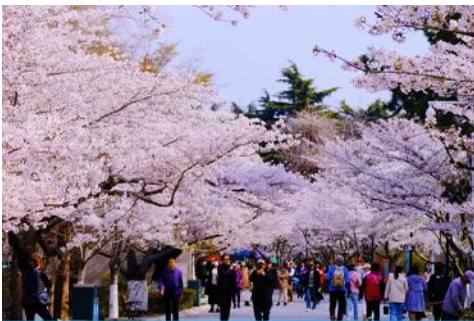
สวนสาธารณะจงซาน

หลังอาหารเช้าเดินทางโดยรถบัสปรับอากาศสู่ เมืองชิงเต่า 青岛 ตั้งอยู่ในมณฑลซานตง เมืองที่ได้ชื่อว่า ยุโรปในแผ่นดินจีน และเมืองที่มีวัฒนธรรมที่ผสมผสานทิวทัศน์ชายทะเลที่สวยงาม มีมนต์เสน่ห์อันเป็นเอกลักษณ์เฉพาะตัว (ใช้เวลาเดินทางประมาณ 3 ชั่วโมง)