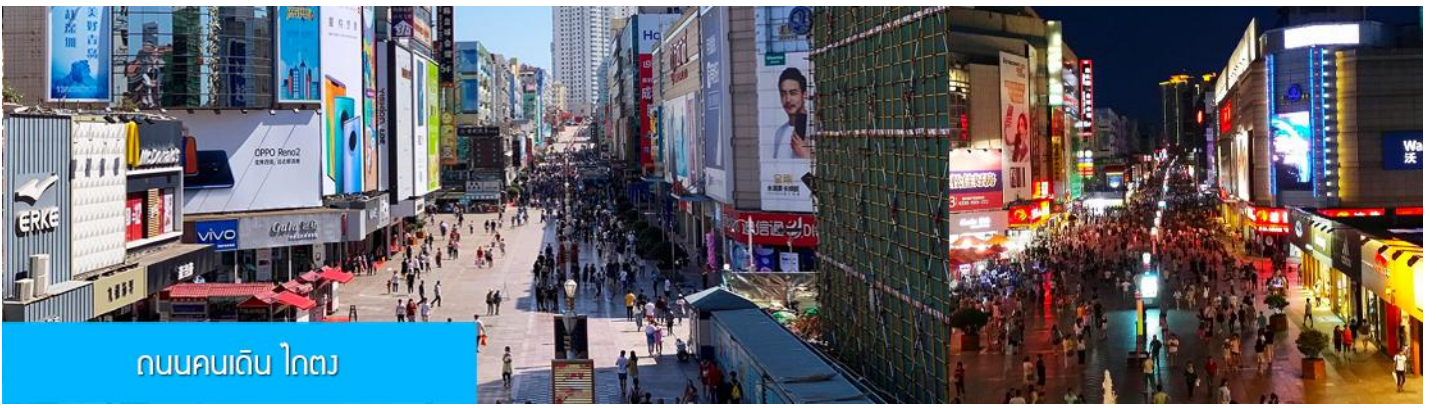
ถนนคนเดิน ไตตง

จากนั้นนำท่าน สู่ ถนนคนเดิน ไตตง 台东步行街 ย่านการค้าเป็นถนนคนเดินที่ใหญ่และคึกคักของเมืองชิงเต่า ที่นี้เป็นแหล่งรวมร้านค้าสินค้าแฟชั่นร่วมสมัย สินค้าพื้นเมือง ของที่ระลึก และร้านอาหาร บาร์เบียร์ของเมืองชิงเต่ามากมาย, ให้ท่านมีเวลาอิสระเดินเล่น ซ้อปปิ้ง ลิ้มรสอาหารพื้นเมือง และเลือกซื้อของฝาก ตามอัธยาศัย