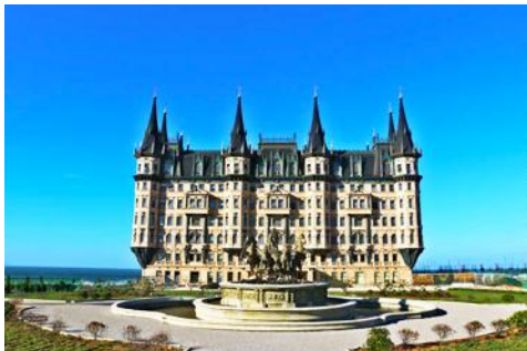
คฤหาสน์เหวินเจิง

หลังอาหารนำท่านไปเยือนเมืองท่าสุดโรแมนติคสไตล์ยุโรป ท่าเรือชาวประมง ให้ท่านได้ชมสถาปัตยกรรมสไตล์อเมริกาเหนือ และ ยุโรป ที่ตั้งอยู่ในพื้นที่ผืนดินจีน ณ เมืองเยียนไถ เก็บบรรยากาศลมทะเล และเก็บรูปกับอาคารหลังคาสี่สลาดเป็นฉากหลัง ที่เต็มไปด้วยมนต์เสน่ห์และความทรงจำที่สวยงาม ให้ท่านเก็บภาพความสุข