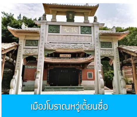
เมืองโบราณหวู่เตี้ยนซื่อ

พักที่ โรงแรม XIAMEN HENGLONG HOTEL 4* หรือเทียบเท่าในเมืองเซี่ยเหมิน