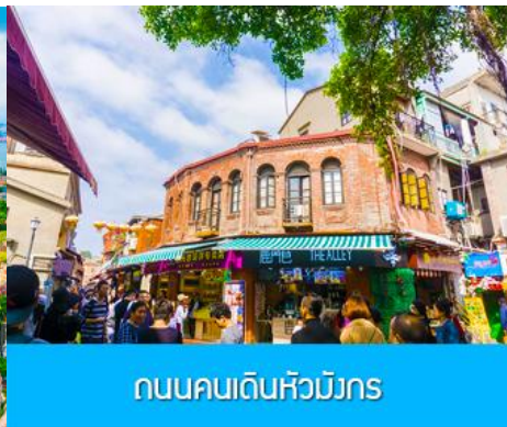
ถนนคนเดินหัวมังกร